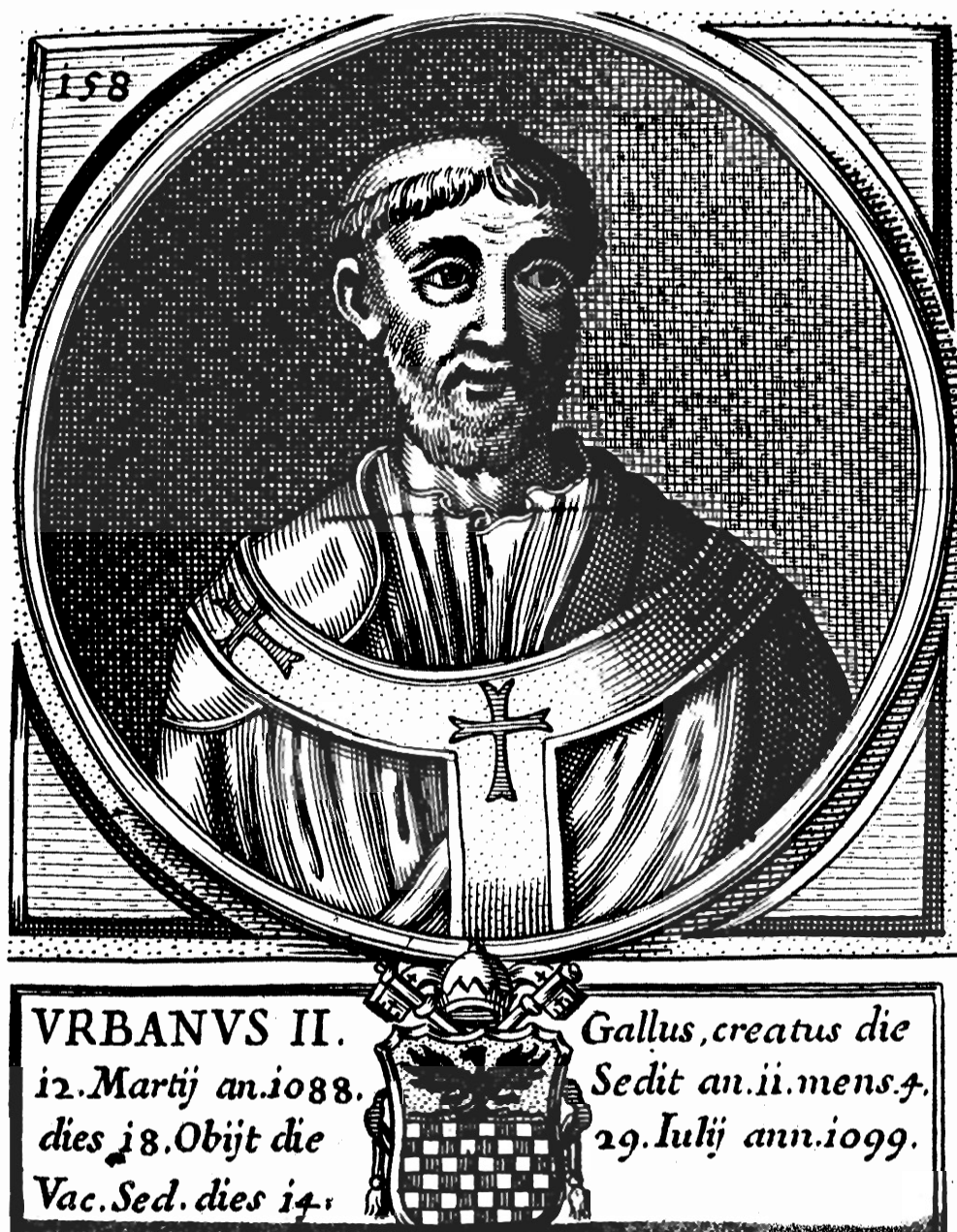
Иллюстрация 3 Папа Урбан II, вдохновитель крестовых походов.

элементов средневекового европейского общества, которые с огромным энтузиазмом отозвались на призыв римского папы Урбана II. Они верили, что цель похода – освободить Святую землю и гроб Иисуса в Иерусалиме – осуществится чудесным образом, без организации военных операций. Крестьянский поход, почти на два года опередивший первый крестовый поход, повлек за собой первую волну убийств и религиозных гонений. Он стал событием, изменившим течение еврейской истории, и превратился в величайшую катастрофу в истории германских евреев того времени.