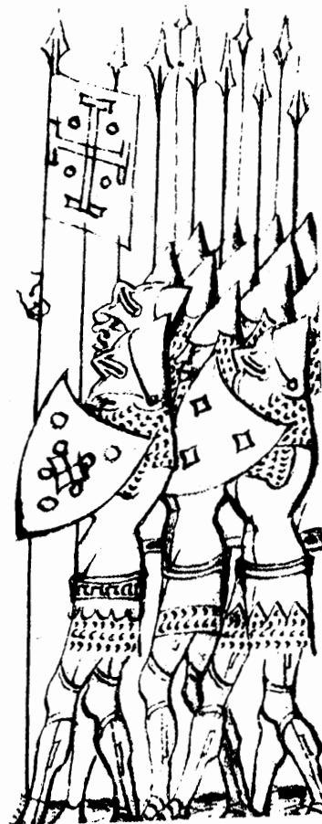
Иллюстрация 4 Крестоносцы выступают в поход; солдаты одеты в кольчуги и шлемы и вооружены копьями.

Не было единства в отношении к крестоносцам (особенно когда речь шла о “добровольцах”) и у двух основных институтов средневековой власти: аристократии и церковной иерархии. Подобно горожанам, светская власть опасалась разрушения, которое несли крестоносцы всюду на своем пути. Власти также не могли пренебречь устойчивым доходом от налогов,