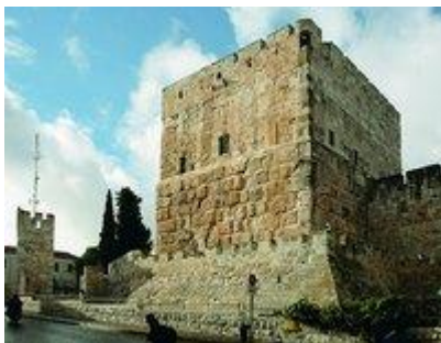
Цит адель (Башня Давида). Фотография. 2008 г.