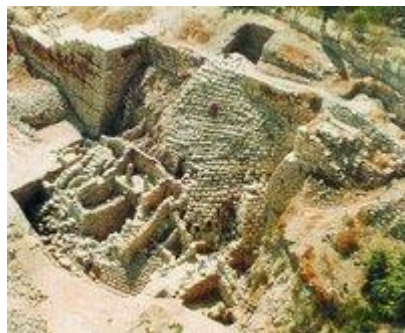
Ступенчатая постройка в городе Давида

Результаты Шестидневной войны 1967 г. стимулировали проведение раскопок в И. Кроме Шило выдающиеся открытия сделали здесь в 1968-1978 гг. Б. Мазар и М. Бен-Дов, исследовав линию вдоль зап. и юж. стен храма. Были найдены артефакты вплоть до 2-й фазы железного века, но следы эпохи Первого храма там, где планировали найти царские кварталы, не были обнаружены. Подтвердились сведения Иосифа Флавия о том, что, готовясь перестроить храм, Ирод вдвое расширил площадь Храмовой горы ( Mazar B . 1978; Ben-Dov . 1985). Были найдены следы разрушения И. римлянами в 70 г. по Р. Х. и более поздние периоды, в частности раскрыты ранневизант. жилые кварталы. Материалы были опубликованы только предварительно в научно-популярной форме (книги Бен-Дова), в научный оборот вводятся лишь в наст. время.