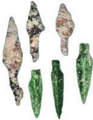
Наконечники стрел из археологических слоев времени разрушения города вавилонянами (обнаружены под основанием сев. башни стены Нееми)

В 3-й четв. XX в. Н. Авигад впервые исследовал центр Еврейского квартала Старого города. Были изучены роскошные дома жителей И. эпохи Хасмонеев и Ирода Великого ( Avigad. 1983; Geva. 2000. Vol. 1 ). Удалось подтвердить существование в ранневизант. эпоху большой кардо именно в том виде, в каком она показана на карте из Мадабы: улица, проложенная по оси «север-юг», шла через весь И. - от Дамасских ворот на севере и почти до Сионских ворот на юге. Было установлено, что заселение зап. холма могло произойти уже в VIII в. до Р. Х. (что может объяснить существование «второй части» ( mišne ) И., упоминаемой в 4 Цар 22. 14). Обнаружение широкой стены на зап. холме обосновывает вывод о том, что в VIII-VII вв. до Р. Х. площадь И. увеличилась в 4 раза, и подтверждает описание Иосифа Флавия допленного И. как очень большого города.