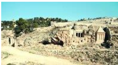
Гробницы эллинистического времени в долине Кедрона. Фотография. 2008 г.

Гессий Флор, последний прокуратор Иудеи, захватил сокровища храма и своим поступком вызвал в 66 г. Первое антирим. восстание. И. покинули христиане, бежавшие в Пеллу. В 70 г. рим. полководец Тит осадил И., построил осадную стену с севера, взял Храмовую гору и Нижний город, а через месяц - Верхний, после чего И. был полностью разрушен. От храма сохранилась только платформа, уцелели 3 башни: Гиппика, Фасаэля и Мариамны, а также часть зап. стены И. ( Jos. Flav. De bell. VII 1. 1 (1-2) ). Взятие города в 70 г. археологически фиксируется в обнаруженных разрушениях каменных сооружений города и храма (вдоль юж. стены Храмовой горы: у ее подножия нагромождены рухнувшие сверху на широкую улицу иродианские каменные блоки). После гибели города в домах находили слои пепла, полопавшуюся от огня каменную посуду, оружие и человеческие скелеты. Между 70 и 132 гг. в И. стоял 10-й легион, жили вернувшиеся из Пеллы христиане и евреи ( Clark. 1960. P. 273-274; Avi-Yonah. 1973. P. 16; Peters. 1985. P. 124-126 ). Поиск лагеря легиона - особая глава в археологии И. Во время осады он стоял на зап. холме, более высоком и с плоской вершиной. Но по всей исследованной территории зап. холма после пожара и разрушения 70 г. наблюдается единая картина запустения, причем последующий слой запустения перекрыт уже наслоениями ранневизант. эпохи (IV-VII вв.).