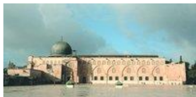
Мечеть Аль-Акса. VIII, XI-XIV вв. Фотография. 2008 г.

Ок. 6 г. по Р. Х. столицей провинции и местом пребывания прокуратора стала Кесария Палестинская . Первосвященник и синагоги сохраняли власть в И., однако ее пределы были ограничены. При римлянах улучшилось водоснабжение И. Понтий Пилат , прокуратор Иудеи (26-36 гг. по Р. Х.), создал сложную систему водосборников. Он построил верхний и нижний акведуки, по к-рым в И. поступала вода из Соломоновой купели между Вифлеемом и Хевроном (их фрагменты обнаружены по всей протяженности водопровода); тем самым была усовершенствована система, созданная еще Хасмонейми.