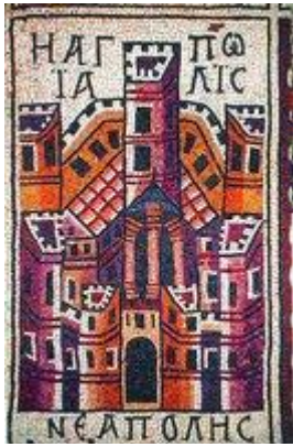
Мозаика ц. св. Стефана в Умм-эр-Расас (Иордания), с изображением Иерусалима и подписью: «Агиаполис. Неаполис» (Святой город. Новый город). 757

Гессий Флор, последний прокуратор Иудеи, захватил сокровища храма и своим поступком вызвал в 66 г. Первое антирим. восстание. И. покинули христиане, бежавшие в Пеллу. В 70 г. рим. полководец Тит осадил И., построил осадную стену с севера, взял Храмовую гору и Нижний город, а через месяц - Верхний, после чего И. был полностью разрушен. От храма сохранилась только платформа, уцелели 3 башни: Гиппика, Фасаэля и Мариамны, а также часть зап. стены И. ( Jos. Flav. De bell. VII 1. 1 (1-2) ). Взятие города в 70 г. археологически фиксируется в обнаруженных разрушениях каменных сооружений города и храма (вдоль юж. стены Храмовой горы: у ее подножия нагромождены рухнувшие сверху на широкую улицу иродианские каменные блоки). После гибели города в домах находили слои пепла, полопавшуюся от огня каменную посуду, оружие и человеческие скелеты. Между 70 и 132 гг. в И. стоял 10-й легион, жили вернувшиеся из Пеллы христиане и евреи ( Clark. 1960. P. 273-274; Avi-Yonah. 1973. P. 16; Peters. 1985. P. 124-126 ). Поиск лагеря легиона - особая глава в археологии И. Во время осады он стоял на зап. холме, более высоком и с плоской вершиной. Но по всей исследованной территории зап. холма после пожара и разрушения 70 г. наблюдается единая картина запустения, причем последующий слой запустения перекрыт уже наслоениями ранневизант. эпохи (IV-VII вв.).