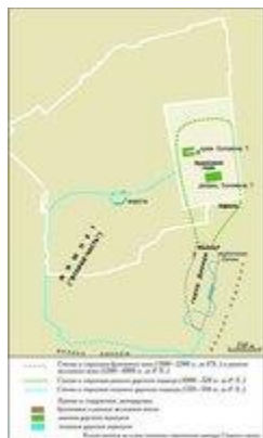
Иерусалим от раннего бронзового века до 586 г. до Р.Х.