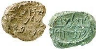
Глиняные оттиски печатей князей Юхала, сына Селемии (слева), и Годолин, сына Пасхора (справа). Кон. VII - нач. VI в. до Р. Х.

Древний И. занимал 2 вершины известнякового плато (800 м над уровнем моря) в центральной нагорной части страны, на границе Иудейской пустыни, вдали от главных торговых путей. К западу от него располагались склоны гор Иудеи; к востоку, до Мёртвого м., - пустыня. Такое положение было выгодно для обороны, но препятствовало экономическому развитию, т. к. пересечения торговых путей в Палестине сосредоточены на прибрежной равнине ( Hopkins . 1970. Р. 11-12).