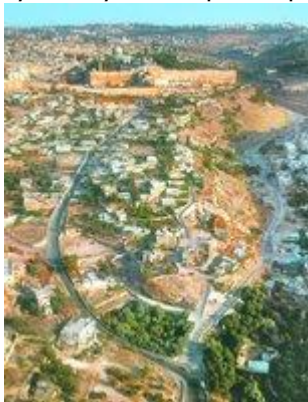
Город Давида. Вид с юга. Аэрофотосъемка

В Библии нет описания города. Понять его топографию помогают сочинения уроженца И. Иосифа Флавия (I в. по Р. Х.), особенно надежные в описании укреплений города (только он описал 3 городские стены) и построек царя Ирода Великого ; необходимо учитывать, что привязки даны к давно не существующим ориентирам, а размеры и расстояния зачастую преувеличены.